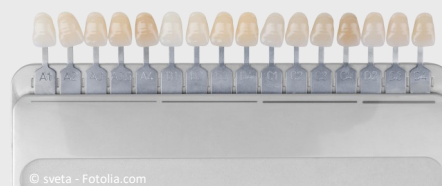
Farbskala zur Bleaching-Kontrolle

Wie schnell die Zähne wieder etwas dunkler werden, hängt davon ab, wie Sie sich ernähren und welche Genussmittel Sie konsumieren: Wenn Sie viel Tee, Kaffee, Rotwein oder Cola trinken und rauchen, werden sie schneller wieder dunkler. Wenn nicht, bleiben sie jahrelang hell.