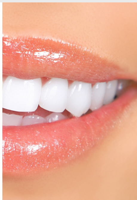
Deutlicher Unterschied: Professionelles Bleaching beim Zahnarzt wirkt!