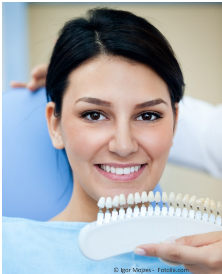
Bleaching vom Zahnarzt: Gewinnendes Lächeln mit strahlend weißen Zähnen

Professionelle Zahnaufhellung durch den Zahnarzt